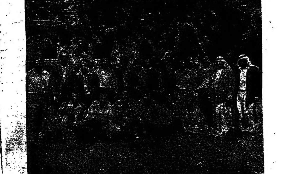
الارشاد والتثقيف التعاوني من الامور الاساسية التي يهتم بها اتحاد المراقبة ارفع مستوى اعضائها الهيئات الادارية ولجان المراقبة والحياة والمخاضين واطلاعهم على كل جديد في هذا المجال .